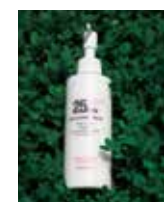
クレンジングミルク25 メイク落とし 210ml ¥5,800

私たちセラピストは、お客様のその日の肌のコンディションを的確にキャッチして、トリートメントを行い結果を出します。そのためには、信頼できる化粧品が最大の味方。このクレンジングは、お肌の皮脂成分に最も近いスクワランオイルと植物抽出エキスで配合。水分と油分の絶妙なバランスで作られているため、大量生産されてるものとは違って洗い上がりのお肌に、余分な油分を残さず、そして、必要な水分は逃しません。みなさん、洗いあがりは『お肌が柔らかい』とびっくりされる“秘密”は、実はこのクレンジングのおかげなのです。